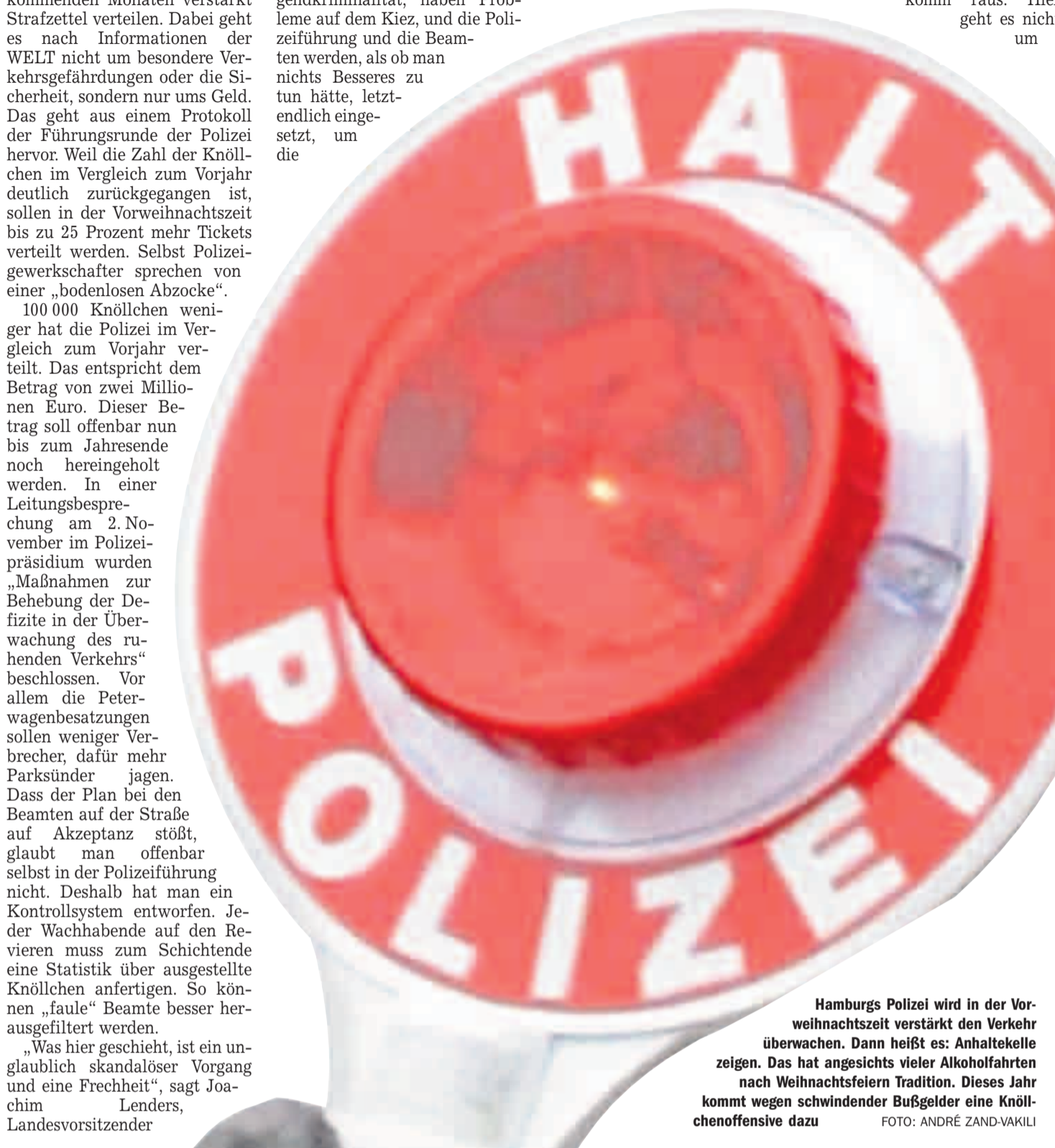
Hamburgs Polizei wird in der Vorweihnachtszeit verstärkt den Verkehr überwachen. Dann heißt es: Anhaltekeile zeigen. Das hat angesichts vieler Alkoholfahrten nach Weihnachtsfeiern Tradition. Dieses Jahr kommt wegen schwindender Bußgelder eine Knöllchenoffensive dazu