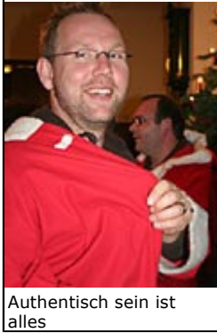
Authentisch sein ist alles

Utensilien wie das als "goldene Buch" dekorierte Ringbuch, die Glocke, die Rute und den Kartoffelsack für die Geschenke, der wegen Einlaufgefahr bloß nicht in der Waschmaschine landen sollte.