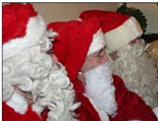
Anwärter auf den Titel